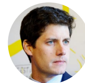
Julien Denormandie, Ministre chargé de la Ville et du Logement

Avec cet appel à projet en faveur de l'agriculture urbaine, l'ANRU va à nouveau participer à changer la vie des habitants des quartiers en mobilisant les énergies des nombreux partenaires associés à cette dynamique. L'État y prendra toute sa part et dévoilera l'ensemble des mesures en faveur de la ville durable le 5 février prochain.